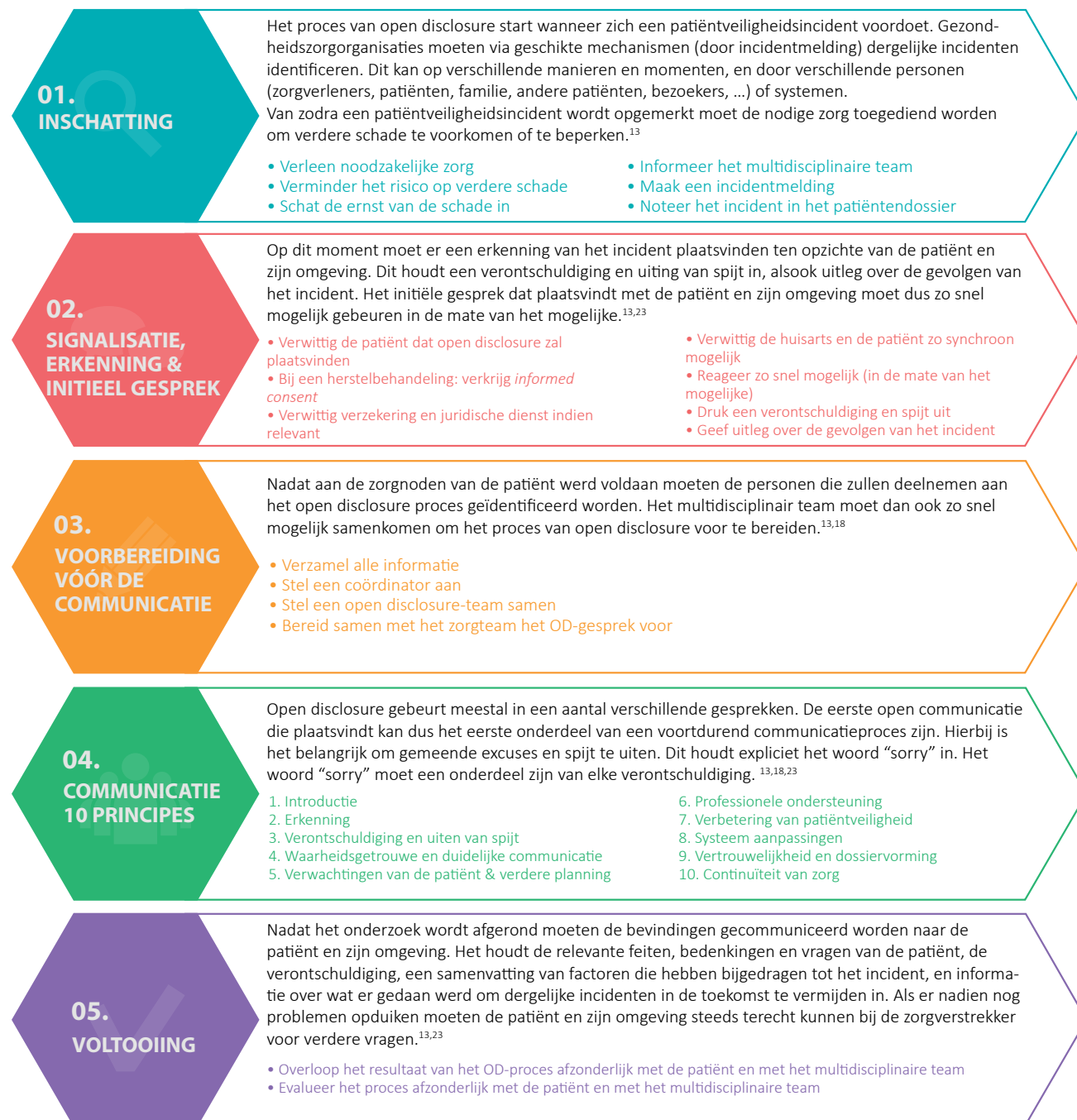
Figuur 2 – Het proces van open disclosure, vanaf het ontstaan van een patiëntveiligheidsincident. 3,13,18,23

Het proces van open disclosure (OD) na een patiëntveiligheidsincident kan via onderstaand schema (figuur 2) samengevat worden. Het schema bevat vijf fasen die je verplicht moet doorlopen. 3,14 Afhankelijk van bepaalde elementen, zoals de ernst van het incident, kan een bepaalde fase zeer kort zijn.